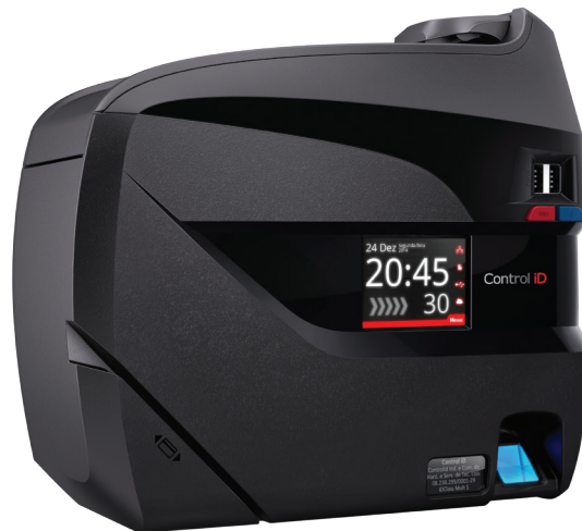
TABELA DE MODELOS