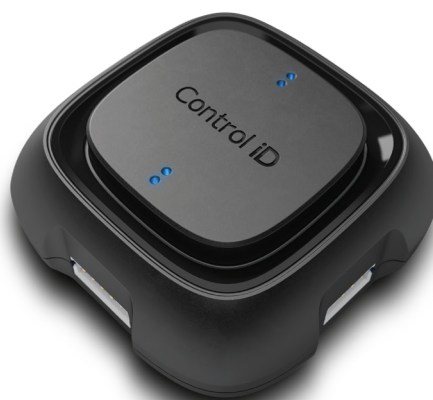
(Módulo de Acionamento)